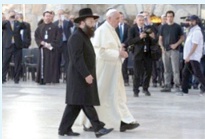
● Đức Giáo hoàng Phanxicô và Rabbi Samuel Rabinovitch tại Thánh Địa năm 2014

Hôm thứ Năm 10-12, Ủy ban Liên lạc với Do Thái giáo thuộc Hội đồng Tòa Thánh về Hiệp nhất Kitô giáo đã giới thiệu bản “suy tư thần học” về một số vấn đề nhạy cảm.