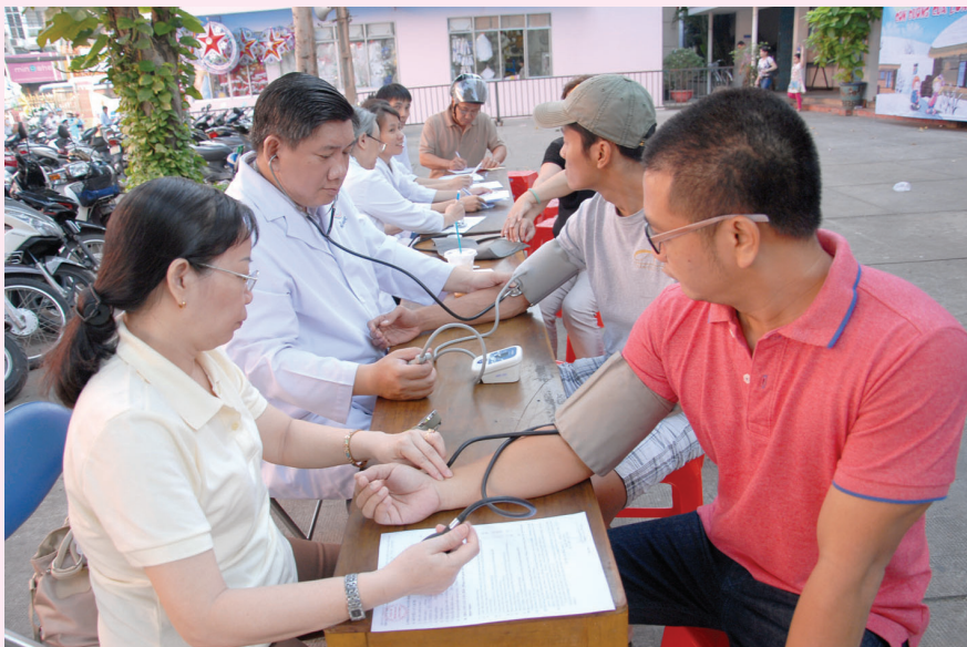
● Tiếp nhận và đo huyết áp cho anh chị giáo dân đến hiến máu

chúng ta cũng đem trao cho những người đang trông chờ như chúng ta mong chờ vào LÒNG THƯƠNG XỐT CHÚA trong năm LÒNG THƯƠNG XỐT này.