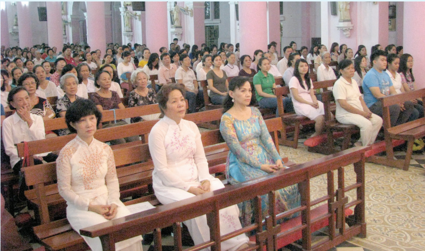
● Hội viên Legio Mariae tham dự Thánh Lễ kính Đức Mẹ Vô nhiễm nguyên tội