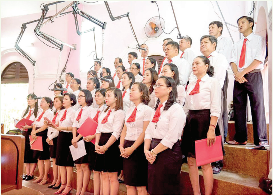
● Ca đoàn Gloria trong Lễ Bồn mạng lần thứ 40