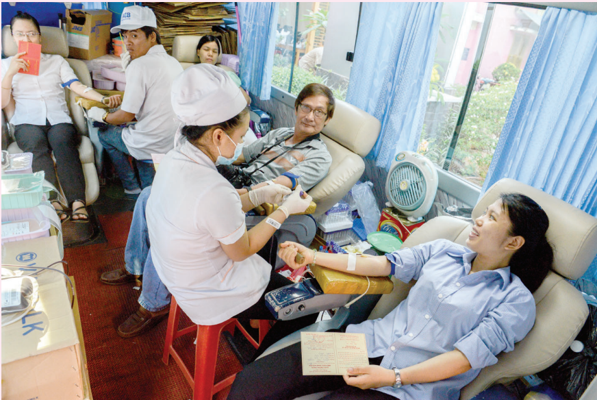
● Anh Chị Em giáo dân đang trao tặng những giọt máu hồng tươi