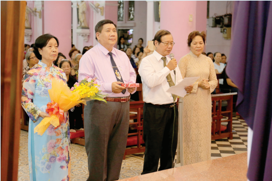
● Đại diện Gia trưởng và Bà Mẹ cảm ơn Cha Giảng phòng Gioan Baotixita