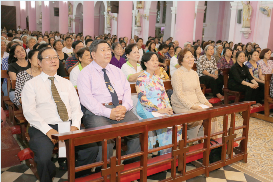
● Cộng đoàn tham dự Tĩnh Tâm Mùa Vọng 2015